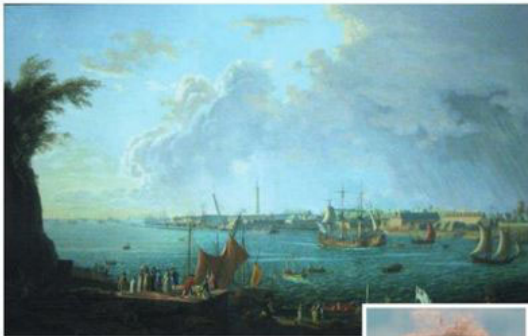
Le port de Lorient à la fin du XVIIIe vu des Cales du Caudan, nom évocateur des liens avec l'histoire de Port-Louis

Elle a poursuivi son récit le temps cette fois de l'épisode de la colonisation hollandaise,